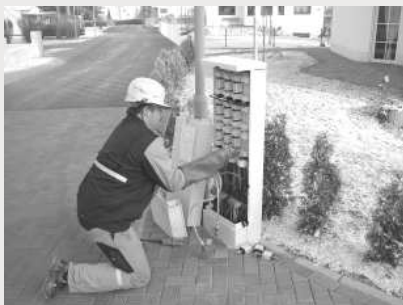
Freischaltung der Hauptversorgungsleitung 0,4 kV (hier entfernt der ovag Netz GmbH -Monteur die Sicherungen im Kabelverteilerschrank).