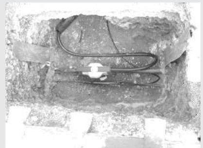
Hausanschlussmuffe nach der Endmontage. Die Isolationsmasse schützt die Abzweigklemme vor Feuchtigkeit.