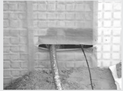
Einführung des PE Rohres durch die Hauswand. Eigenleistung des Hauseigentümers

2.7 Tiefbauarbeiten sind in unseren Angeboten nicht enthalten. Diese können Sie ggf. gemeinsam mit weiter notwendigen Anschlussarbeiten (Wasser, Kanal, Gas, Telekommunikation, ...) bei einem Tiefbauunternehmen oder Ihrem Stadtwerk beauftragen. Zur Herstellung des Netzanschlusses ist ein Kabelgraben vom Hausanschlussraum geradlinig über die Grundstücksgrenze bis zum Verteilungsnetz im Bürgersteig so auszuheben, dass das Kabelschutzrohr in welches wir das Kabel einziehen ca. 60 cm tief unter der endgültigen Erdoberfläche zu liegen kommt. Das Rohr ist von Ihnen zu beschaffen und einzubauen. Es darf nur ein Rohr mit der Bezeichnung Weich PE Rohr 63 x 6,8 mm Durchmesser nach DIN 8072, Nenndruck 6 bar, in schwarz ohne Farbkennzeichnung verwendet werden (Erhältlich in Baustoffhandlungen). Das Rohr ist 5 cm von der Kellerinnenwand des Hausanschlussraumes zurückversetzt in die Mauer wasserdicht einzubauen. Für den Einbau und die Abdichtung der Gebäudeeinführung ist der Anschlussnehmer verantwortlich. In das Rohr bitte einen Zugdraht einlegen und das im Erdreich liegende Rohrende abdichten, damit kein Wasser eindringen kann und keine Erde eingeschlämmt wird. Der Kabelgraben ist mit Erde, nicht mit Schutt, zu füllen.