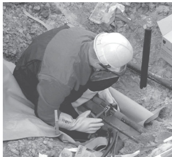
Mitarbeiter bei der Montage eines Netzanschlusses.