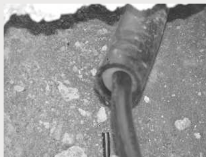
Einführen des Hausanschlusskabels in das zuvor eingebaute PE-Rohr (Abdichtring gut sichtbar).

Der Netzanschluss ist die Verbindung des Verteilungsnetzes mit der Kundenanlage, beginnend an der Abzweigstelle (Netzanschlusspunkt) des Niederspannungsnetzes und endend mit der Hausanschlusssicherung (max. 3x125A). Kabellängen über 15m werden zusätzlich in Rechnung gestellt.