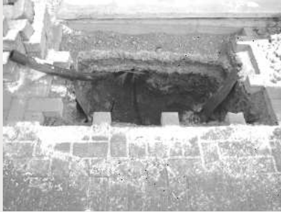
Muffengrube im Gehwegbereich