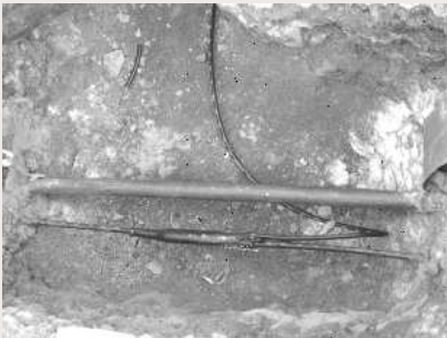
Freigelegte Hauptversorgungsleitung 0,4 kV (zur späteren Montage des Netzanschlusskabels). Hier ist auch die Telefonleitung (dünnes Kabel) gut sichtbar.